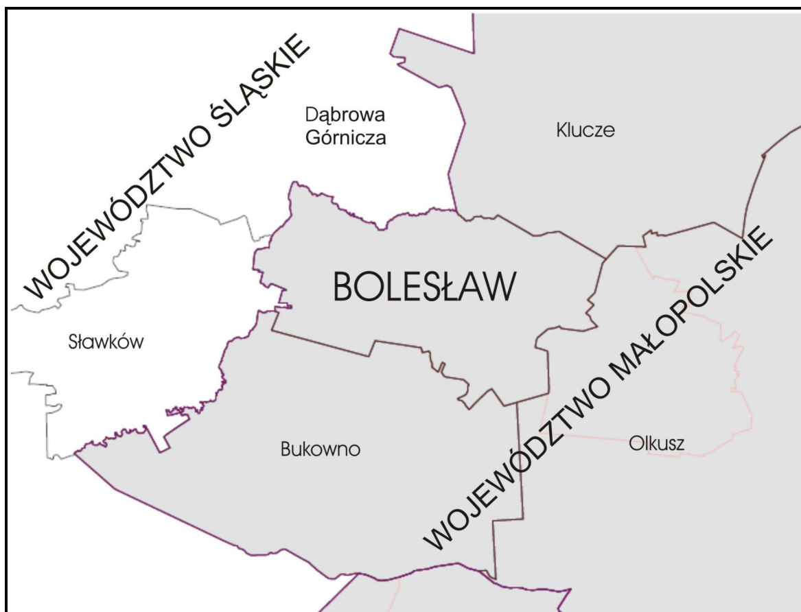
Rysunek 1. Położenie gminy Bolesław na tle powiatu olkuskiego

Gmina Bolesław zajmuje powierzchnię 4 134 ha (41,34 km 2 ), przy czym znaczną część tej powierzchni stanowi teren Krajobrazowego Parku Jurajskiego. W jej skład wchodzi 12 sołectw: Bolesław, Hutki, Krażek, Krzykawę, Krzykawkę, Krze, Laski, Małobądz, Międzygórze, Podlipie, Ujków Nowy Kolonię i Ujków Nowy. Gminę zamieszkuje obecnie 7808 osób (stan na 31 grudnia 2008 r.). Średnia gęstość zaludnienia wynosi 188 osób na km 2 .