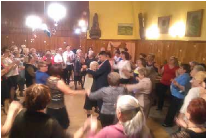
W bolesławskiej remizie...