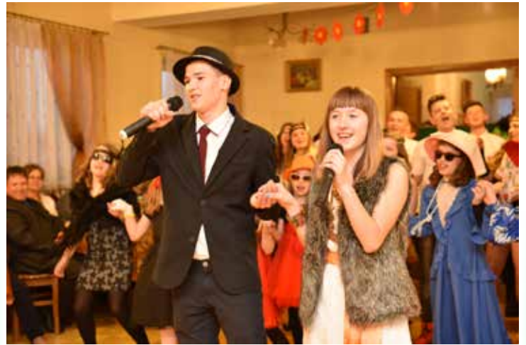
Wiele działo się w Ujkwie Nowym.