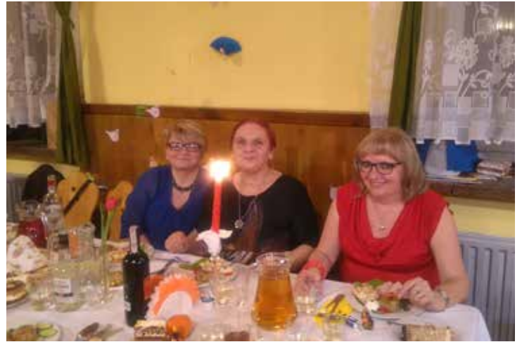
Panie świętują w Bolesławiu...