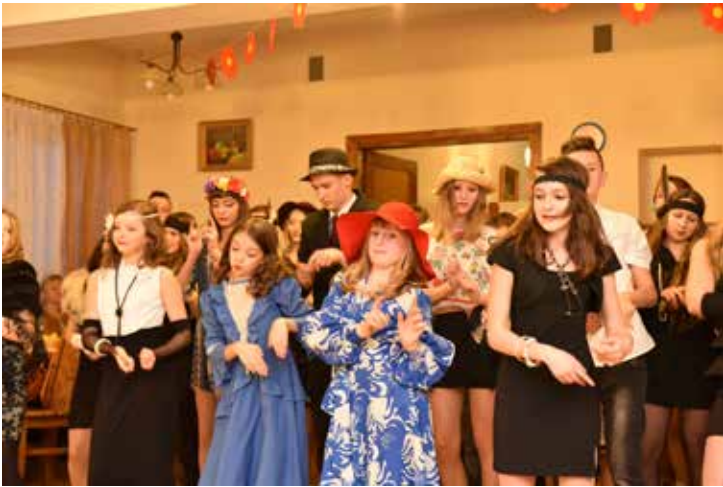
Wiele działo się w Ujkwie Nowym.