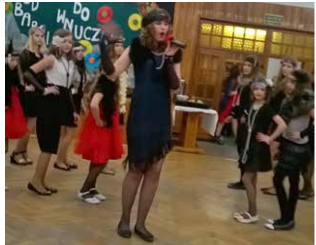
Kilka pokoleń kobiet bawiło się w Krzykawie.