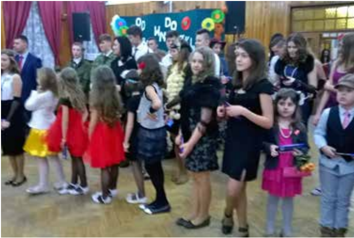
Występy w Krzykawie.