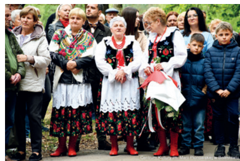
Centrum Kultury im. Marii Płonowskiej w Bolesławiu