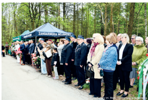
Centrum Kultury im. Marii Płonowskiej w Bolesławiu