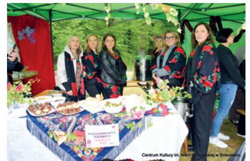
Centrum Kultury im. Marii Płonowskiej w Bolesławiu