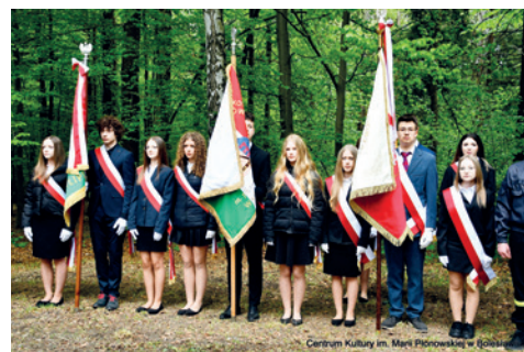
Centrum Kultury im. Marii Płonowskiej w Bolesławiu