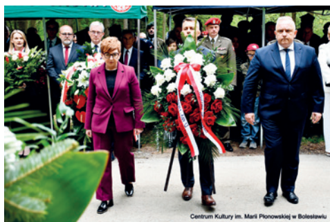
Centrum Kultury im. Marii Płonowskiej w Bolesławiu