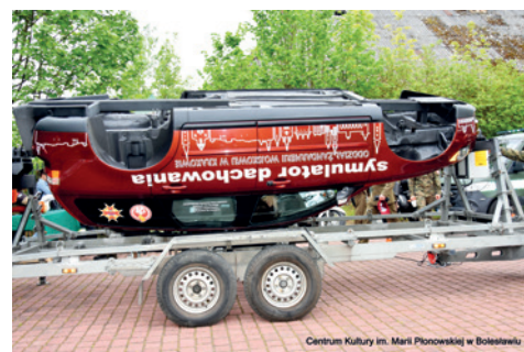
Centrum Kultury im. Marii Płonowskiej w Bolesławiu