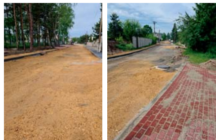
Przebudowa ul. Leśnej w Laskach, fot. arch. UG

Zakończenie wszystkich robót przewidziano na listopad 2024 roku.