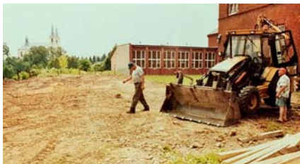
Rozpoczęcie rozbudowy Szkoły Podstawowej w Bolesławiu o salę gimnastyczną wraz z łącznikiem na potrzeby gimnazjum – etap I

- wymiana stolarki okiennej w budynku urzędu gminy - prace remontowo-budowlane w budynkach oświatowych: naprawa dachu w budynku SP w Bolesławiu, remont podjazdu dla niepełnosprawnych przed budynkiem SP w Krzykawie, zabezpieczenie przeciwodne budynku SP w Podlipiu, wymiana