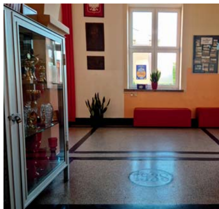
Wejście do starej części SP w Bolesławiu

Wszystkie roboty zaplanowane są w okresie od VI do VIII 2024 roku.