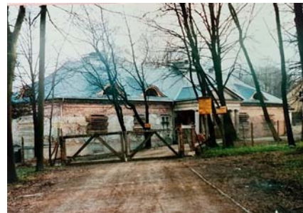
Zakończenie I etapu remontu i rewaloryzacji zabytkowego dworku w Bolesławiu