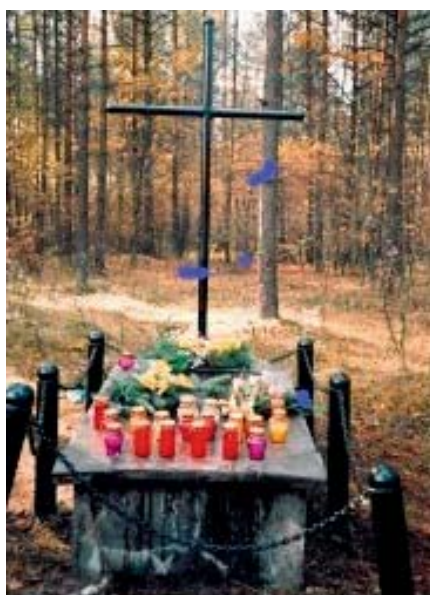
Pomnik w osadzie Biała przed remontem

w Krzu i drogi „łącznik” w Ujkowie Nowym - remonty w gminnych placówkach oświatowych: wymiana rynien i rur spustowych oraz remont parkingu przy Szkole Podstawowej w Krzykawie - remont ogrodzenia dworku w Bolesławiu - remont schodów wejściowych do budynku GOK – wejście do wcześniejszej siedziby poczty (obecny budynek GOPS) - budowa linii napowietrznej niskiego napięcia dla oświetlenia ulicy Kopalnianej - remont płyty oraz tablicy upamiętniającej walki partyzantów w dawnej osadzie Biała pod Laskami (opiekę nad płytą od 1972 roku sprawowali uczniowie Szkoły Podstawowej w Laskach, którym zadanie to powierzył Powiatowy Obywatelski Komitet Ochrony Pomników Walki i Męczeństwa w Olkuszu)