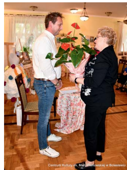
Centrum Kultury im. Marii Płonowskiej w Bolesławiu