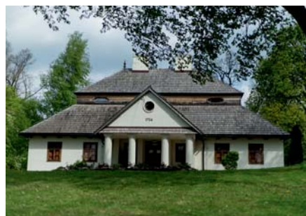
Dworek w Krzykawce, fot. Piotr Dziąbek

Zadanie zostanie wykonane do końca czerwca 2024 roku.