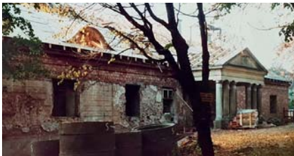
Remont i rewaloryzacja zabytkowego dworku w Bolesławiu – etap I, fot. z archiwum Z. Strasia