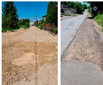
Budowa kanalizacji

Jednocześnie trwa przygotowanie postępowania przetargowego na budowę kanalizacji sanitarnej w miejscowości Krze i Małobądz (etap II) - Krze (ul. Słoneczna, ul. Krótka) i Małobądz (ul. Miła i ul. Górna od budynku przy ul. Laskowskiej 1 do budynku przy ul. Górnej 33), na ulicy Miodowej w Krzykawce oraz instalacji fotowoltaicznej na oczyszczalni ścieków w Laskach. Na ten cel gmina pozyskała środki w wysokości 6.123.449,98 zł z Rządowego Funduszu Polski Ład: Program Inwestycji Strategicznych.