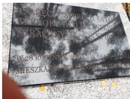
Pomnik w osadzie Biała po remoncie