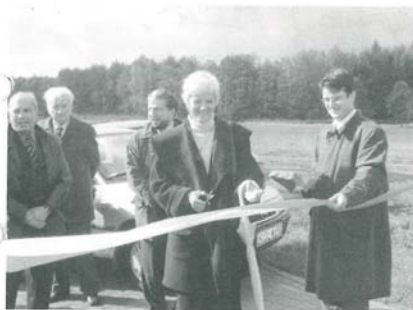
Uroczyste otwarcie Oczyszczalni Ścieków w Laskach

8 października nastąpiło uroczyste otwarcie oczyszczalni ścieków w Laskach.