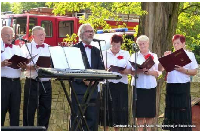
Centrum Kultury im. Marii Płonowskiej w Bolesławiu