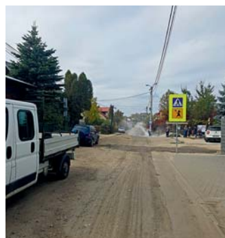
Krzykawka - budowa kanalizacji sanitarnej - w trakcie realizacji- Prace przygotowawcze przed odtworzeniem drogi i wykonaniem nawierzchni asfaltowej

Przed realizacją budowy kanalizacji sanitarnej lub przed rozpoczęciem robót drogowych – Przedsiębiorstwo Wodociągów i Kanalizacji sp. z o.o. w Olkuszu, dokonało przeglądu swoich istniejących sieci i w przypadku takiej konieczności przeprowadziło modernizację sieci wodociągowych lub wykonało nowe odcinki sieci, w celu umożliwienia podłączenia nowych odbiorców. Należy zaznaczyć, że wszędzie tam, gdzie Gmina buduje kanalizację sanitarną odtwarza nawierzchnię dróg, bez względu na to, czy zarządcą drogi jest Gmina czy Powiat. W ten sposób zostały wyremontowane drogi w Pniakach, Starowiejska i Słoneczna w Krzykawce. Na realizację odtworzenia nawierzchni przygotowywane są ulica w Krzykawce oraz ul. Fr. Nullo w Krzykawce. ●