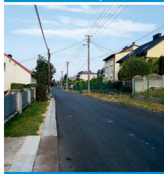
Krzykawka - ul. Starowiejska po budowie kanalizacji i wymianie instalacji wodociągowej oraz wykonaniu nawierzchni drogi