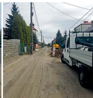
Krzykawka - budowa kanalizacji. Prace związane z wykonywaniem przyłączy do domów