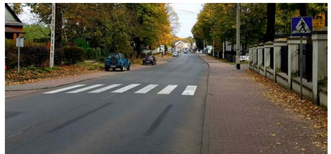
Centrum Bolestawia oczekujące na modernizację. Dofinansowanie już jest.

Mieszkańcy Gminy od dawna wnioskuje o przebudowę w celu uatrakcyjnienia centrum, przystosowania go do obecnych standardów a także przystosowania do wymogów bezpieczeństwa.