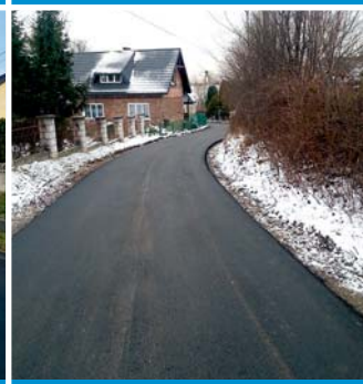
Ulica Pniaki po wykonaniu kanalizacji i nawierzchni asfaltowej