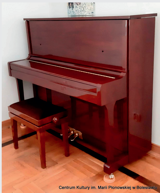
Centrum Kultury im. Marii Płonowskiej w Bolesławiu