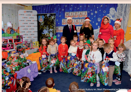
Centrum Kultury im. Marii Płonowskiej w Bolesławiu