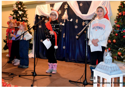
Centrum Kultury im. Marii Płonowskiej w Bolesławiu