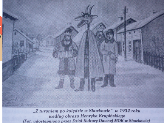
„Z turoniem po koledzie w Sławkowie” w 1932 roku według obrazu Henryka Krupńskiego

do ogrodu, albo na pole kupeczkę nawozu. Nie mogliśmy się jednak dowiedzieć na co.