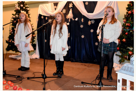
Centrum Kultury im. Marii Płonowskiej w Bolesławiu