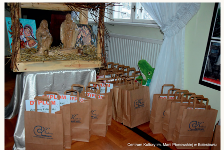
Centrum Kultury im. Marii Płonowskiej w Bolesławiu