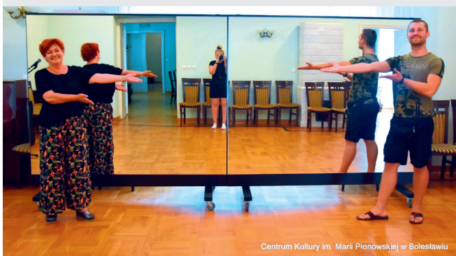
Centrum Kultury im. Marii Płonowskiej w Bolestawiu

Serdecznie dziękujemy Ministrowi Kultury i Dziedzictwa Narodowego za otrzymane dofinansowanie.