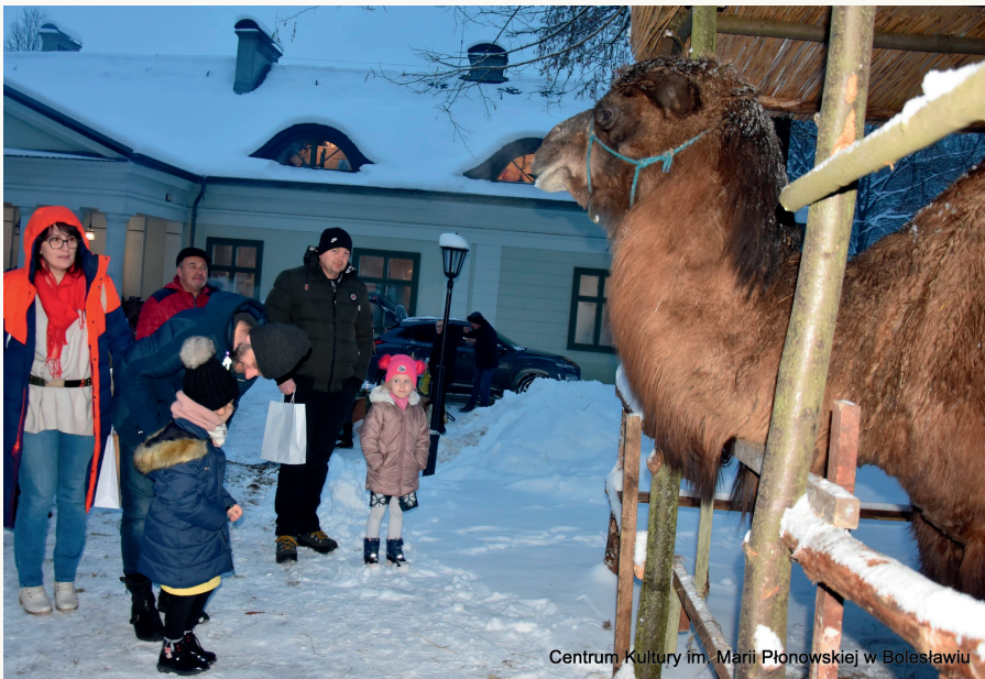
Centrum Kultury im. Marii Płonowskiej w Bolesławiu