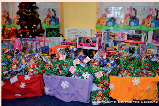
Centrum Kultury im. Marii Płonowskiej w Bolesławiu