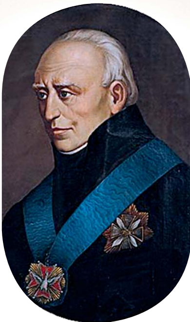
Stanisław Staszic (1755-1826)

Staszic był jednym z czołowych reformatorów i uczonych polskiego oświecenia. Działal na rzecz poprawy położenia chłopów. Zwolennik gruntownych reform systemowych w I Rzeczypospolitej, w okresie Sejmu Wielkiego wspierał piórem zmiany przeprowadzane przez parlament. Odegrał ważną rolę w rozwoju przemysłu, działając jako geolog i badacz natury. Przygotował wówczas plan rozbudowy Staropolskiego Okręgu Przemysłowego. Wznowił eksploatację węgla kamiennego ze złoża Reden na terenie Dąbrowy Górniczej. Z inicjatywy monarchy Stanisława Augusta Poniatowskiego w 1779 roku zo-