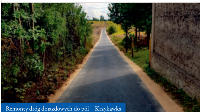
Remonty dróg dojazdowych do pól – Krzykawka

Kolejną ważną inwestycją były remonty dróg dojazdowych do gruntów rolnych w Krzykawce, Bolesławiu i Podlipiu. Na realizację tych zadań pozyskano dofinansowanie z Urzędu Marszałkowskiego Województwa Małopolskiego. W ramach remontów wykonano prace ziemne, podbudowy dróg oraz ich nawierzchnie wraz ze zjazdami do gruntów rolnych. Na niektórych z odcinków dróg wykonane zostały również pobocza. Oddane do użytku, wyremontowane trakty, posłużą nie tylko rolnikom. Skorzystają z nich wszyscy mieszkańcy gminy, gdyż stanowią one uzupełnienie sieci drogowej w sołectwach. Ich modernizacja przełoży się na poprawę bezpieczeństwa i warunki życia mieszkańców. W dłuższej perspektywie przyczynią się zaś do rozwoju gospodarczego poszczególnych miejscowości na terenie Gminy Bolesław.