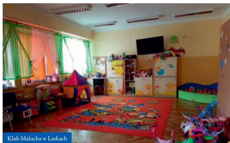
Klub Malucha w Łaskach

Budynek Przedszkola w Boleśławiu został dostosowany do obecnie obowiązujących przepisów w zakresie ochrony przeciwpożarowej. Dokonano także kapitalnego remontu szatni, sal zajęć oraz łazienek na parterze. Prace wykonane zostały nieodpłatnie przez rodziców, mieszkańców, nauczycieli i skazanych. Przedszkole zyskało bardzo piękne wnętrza. Opracowano także dokumentację, która służy przy zagospodarowywaniu placu zabaw na terenie przedszkola. ●