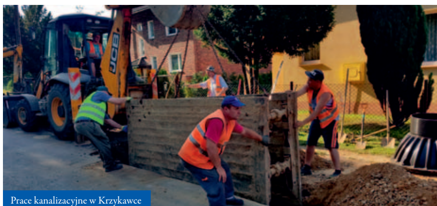
Prace kanalizacyjne w Krzykawce

Dużo uwagi poświęca się również kulturze, rozrywce i rekreacji. Gmina Bolesław wspiera mieszkańców w aktywnym wypoczynku i uprawianiu sportu. Służyć temu mają inwestycje w obiekty sportowe, place zabaw, zewnętrzne siłownie i inne strefy aktywności. Takie miejsca znajdują się