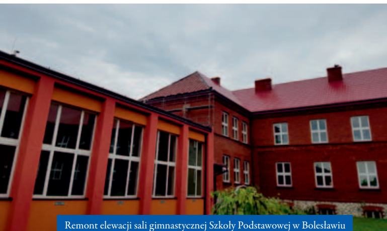
Remont elewacji sali gimnastycznej Szkoły Podstawowej w Bolesławiu

Kolejną szkołą, która zyskała nowe oblicze jest placówka w Krzykawie. Budynek został gruntownie zmodernizowany pod kątem ochrony przeciwpożarowej. Podczas remontu wymieniono drzwi, przebudowano instalacje wodociągowe i przeciwpożarowe wraz z hydrantami oraz unowocześniono instalacje oświetlenia awa-