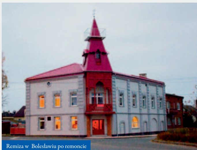
Remiza w Bolesławiu po remoncie

Ochotnicza Straż Pożarna w Bolesławiu powstała w 1907 roku. Niedawno świętowaliśmy więc 110-lecie jej istnienia. Wieloletnia tradycja OSP w gminie to powód do dumy dla mieszkańców. Druhowie zaś mogą pochwalić się strażnicą, która przeszła kapitalny remont w części zewnętrznej. Prace zaczęły się od wymiany pokrycia dachowego i rynien. Kolejnym etapem prac była termomodernizacja obiektu. Strażnica OSP Bolesław uzyskała także nowe bramy garażowe, drzwi wejściowe. Została przeprowadzona wymiana instalacji centralnego ogrzewania. Stary piec został zastąpiony oszczędnym i nowoczesnym gazowym modelem. Wymieniono też grzejnik i układ sterowania. Zmodernizowano również zaplecze kuchenne. Zlikwidowano przestarzałe chłodnie zastępując je oszczędnymi jednostkami sfinansowanymi w ramach Funduszu Sołeckiego. Na tym jednak nie koniec. W niedalekiej przyszłości planowany jest także remont instalacji elektrycznej i remont wnętrza budynku wraz z odtworzeniem sceny.