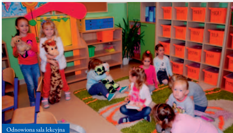
Odnowiona sala lekcyjna