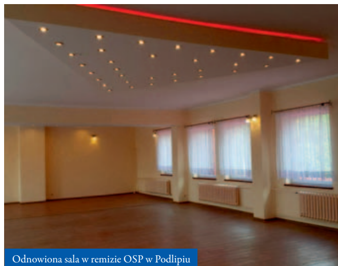
Odnowiona sala w remizie OSP w Podlipiu

nia Koła Gospodyń oraz sali głównej. Prace obejmowały wymianę instalacji elektrycznej, oświetlenia oraz położenie tynków, gładzi i malowanie. Prace budowlane w całym budynku były wykonane nieodpłatnie przez skazanych z zakładu karnego w Trzebini, jak również przez druhow strażaków, którzy nie szczędzili swojego czasu i zaangażowania. Zmodernizowano również instalację centralnego ogrzewania, która polegała na wymianie grzejników i pieca na nowoczesny i oszczędny model gazowy. Dla remizy w Pod-