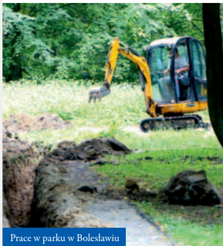
Prace w parku w Bolesławiu

Zabytkowy park przy Dworku coraz bardziej zmienia swoje oblicze. Pierwszym krokiem mającym na celu rewitalizację tego terenu była inwentaryzacja drzewostanu. Uporządkowano zieleni i dokonano wycinki drzew, które były w najgorszym stanie. Niewątpliwym sukcesem było pozyskanie na ten cel środków z Wojewódzkiego Funduszu Ochrony Środowiska w Krakowie. Był to jednak tylko wstęp do dalszych prac.