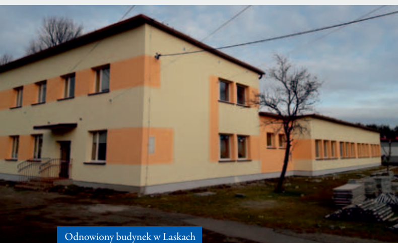
Odnowiony budynek w Łaskach

Placówka w Łaskach została poddana gruntownej termomodernizacji. W ramach inwestycji ocieplane są ściany budynku wraz z wykonaniem tynków (w chwili oddawania gazety do druku prace nadal trwają). Wymieniono częściowo stolarkę drzwi i okien. Renowacji poddano parkiet w salach dydaktycznych. Wyremontowano także pomieszczenia na piętrze budynku. Dzięki temu poprawił się komfort nauki, a koszty ogrzewania obiektu znacząco spadły. Ponadto, w budynku, gdzie znajduje się przedszkole i szkoła podstawowa powstał też Klub Dziecięcy „Leśna Kraina”. Do Klubu przyjmowane są dzieci od ukończenia 1 roku życia do 3 lat. W tym celu przygotowano specjalną salę, szatnie oraz toalety, które zostały wyremontowane i wyposażone. Inwestycja uzyskała dotację z programu Ministerstwa Pracy i Polityki Społecznej „Maluch 2016”.