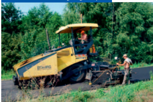
Prace remontowe na drogach gminnych

lonii. Wybudowano linię oświetlenia przy ul. Leśnej w Małobądzu. Wyremontowano także ul. Cichą w Kolonii i Laskach, ul. Kopalnia-