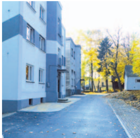
Nowa nawierzchnia drogi przy blokach w Bolesławiu