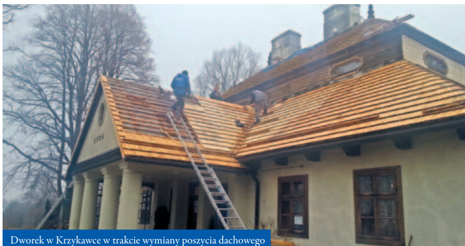
Dworek w Krzykawce w trakcie wymiany poszycia dachowego

zostały nieodpłatnie przez skazanych w Zakładzie Karnym w Trzebinie ze stali zakupionej przez gminę. Budynek został też wyposażony w nową instalację odgromową. Realizacja całego przedsięwzięcia zakończy się w maju 2018 roku, ale efekty pracy widać już teraz!