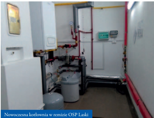
Nowoczesna kotłownia w remizie OSP Laski

W obiekcie dokonano gruntownej modernizacji instalacji elektrycznej oraz oświetlenia. Obiekt przeszedł kapitalny remont polegający na: wymianie instalacji elektrycznej i oświetleniowej, położeniu gładzi oraz tynkowaniu i pomalowaniu ścian. Wymieniono także drzwi boczne prowadzące do sali głównej. Przeprowadzono również gruntowny remont i modernizację sanitariatów. Kwota przeznaczona na zakup materiałów budowlanych potrzebnych do remontu pochodziła z Funduszu Sołeckiego. Prace murarsko-tynkarskie (łącznie z malowaniem) zostały wykonane przez skazanych nieodpłatnie.