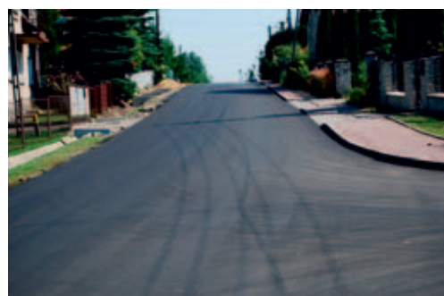
Nowe nawierzchnie na ulicach: Bolesławskiej w Kolonii i Szkolnej w Bolesławiu

laniami była bieżąca konserwacja dróg, wiat przystankowych oraz oświetlenia ulicznego będącego własnością gminy. Zaktualizowano także ewidencję dróg i opracowano jej elektroniczną wersję.