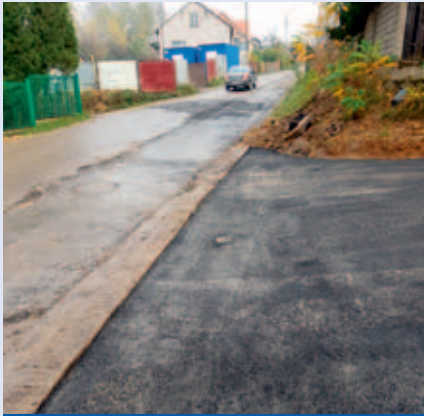
Odtworzenie nawierzchni po pracach kanalizacyjnych – Krzykawka, ul. Podgórska

w czołówce najbardziej pożądaných obiektów. Mieszkańcy chcą, aby w pobliżu ich domów powstawały takie miejsca. A władze naszego samorządu wychodzą naprzeciw tym oczekiwaniom.