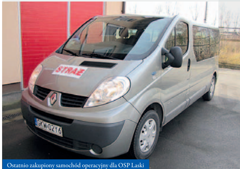
Ostatnio zakupiony samochód operacyjny dla OSP Laski

Ogromne znaczenie w służbie OSP ma jakość sprzętu, z jakiego korzystają strażacy-ochotnicy. Władze Gminy starają się systematycznie doposażać jednostki Ochotniczej Straży Pożarnej w sprzęt i ubrania ochronne oraz samochody. Do tej pory, w ramach dbania o szeroko rozumiane bezpieczeństwo publiczne zostały zakupione i przekazane średnie samochody dla OSP Podlipie (Renault Premium) i OSP Krzykawie (Renault Midlum) oraz samochód lekki dla OSP Bolesław (Volkswagen Transporter) i OSP Laski (Renault Trafic).