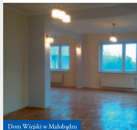
Dom Wiejski w Malobądz

W ramach środków pozyskanych z funduszy europejskich zaadaptowano na cele Klubu Integracji Społecznej pomieszczenia poniżej parteru w budynku GOPS. Łazienki dostosowano do potrzeb osób niepełnosprawnych. W budynku pojawił się też schodolaz, czyli urządzenie ułatwiające poruszanie się po schodach osobom ze schorzeniami narządów ruchu. Zadbane, odnowione pomieszczenia służą naszym mieszkańcom zgodnie ze swoim przeznaczeniem. ●