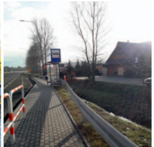
Przystanek przy drodze krajowej przy skrzyżowaniu z ul. Wyzwolenia