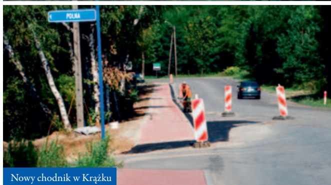
Nowy chodnik w Krążku

ców. Dlatego Gmina Bolesław współfinansuje także prace przy drogach powiatowych. W tym celu udzielono m.in. dotacji na remont ul. Bolesławskiej oraz przebudowę ul. Poręba w Kolonii. Gmina wsparła modernizację odcinka drogi ul. Ponikowskiej oraz remont chodnika przy ul. Głównej w Bolesławiu. Dofinansowano modernizację drogi