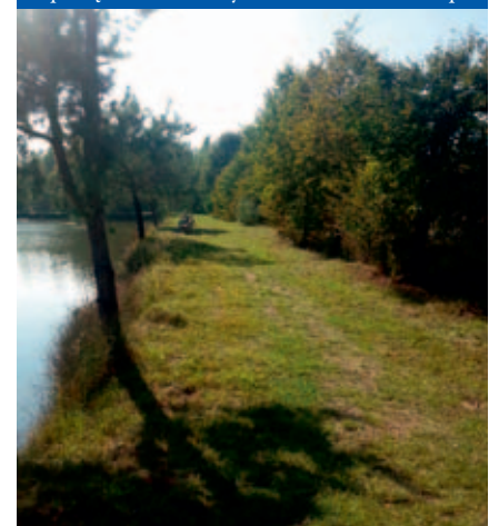
Uporządkowane tereny wokół stawów w Podlipiu