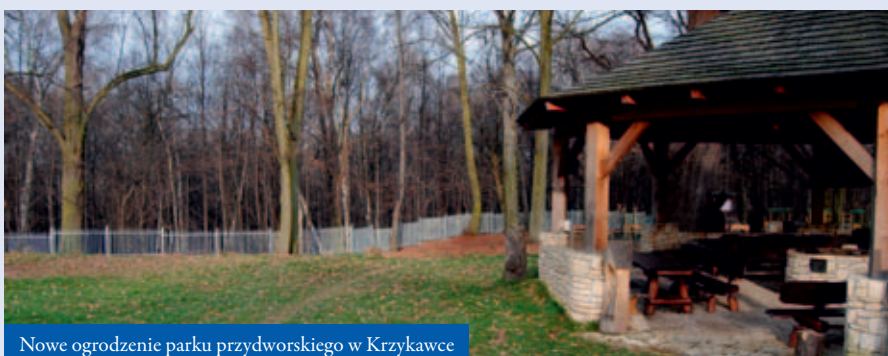
Nowe ogrodzenie parku przydworskiego w Krzykawce

ślizgawkę i ściankę wspinaczkową. Fani sportu mogą korzystać z urządzeń typu „biegacz” i „orbitrek”, stołu do ping-ponga oraz boiska z bramkami, na którym można grać w piłkę nożną, koszykówkę i siatkówkę. W trosce o bezpieczeństwo najmłodszych na terenie obiektu zamontowano bezpieczną nawierzchnię amortyzującą upadki.