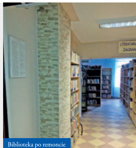
Biblioteka po remoncie

Nowy wizerunek zyskała także nasza biblioteka. W tym roku zakończył się generalny remont obiektu. W ramach prac położono m.in.: płytki i gładzie wraz z malowaniem ścian na klatce schodowej, w wypożyczalni, w pozostałych pomieszczeniach oraz toaletach. Wymieniono drzwi i wymalowano kotłownię oraz kraty w oknach na zewnątrz. Wszystkie prace bezpłatnie wykonywali więźniowie z Zakładu Karnego w Trzebinie. W planach remontowych pozostaje również główna sala w bibliotece – wykonamy go, aby