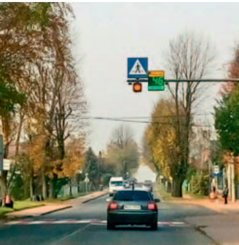
Urządzenie do pomiaru prędkości przy Szkole Podstawowej w Bolesławiu