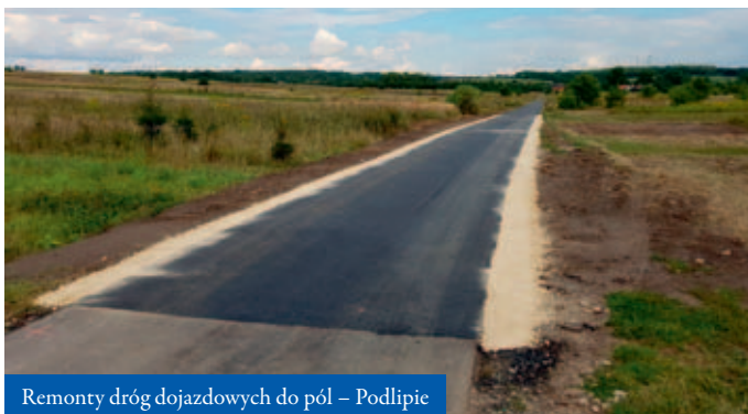
Remonty dróg dojazdowych do pól – Podlipie