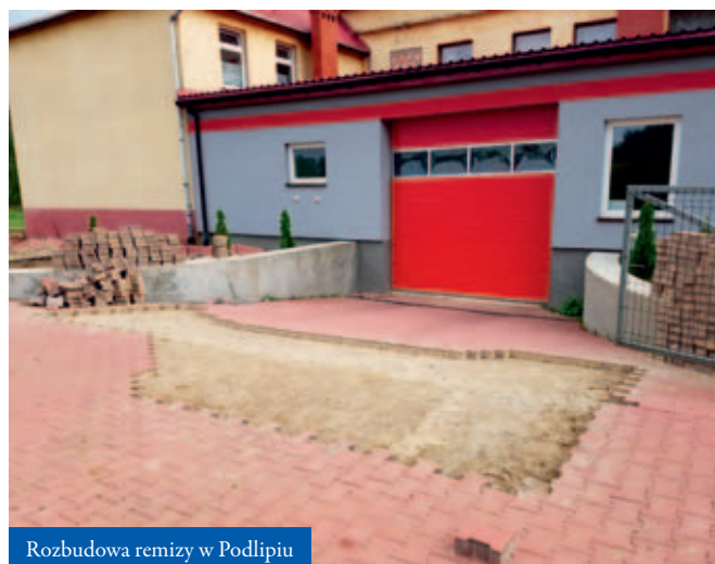
Rozbudowa remizy w Podlipiu

dobudowanej części bojowej. Nie obyło się też bez remontu wnętrza, gdzie przeprowadzono generalną modernizację pomieszcze-