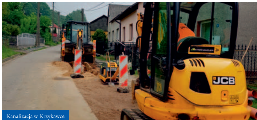
Kanalizacja w Krzykawce

N asza gmina ma charakter wiejski. Jej działalność opiera się na sołectwach. Dlatego też inwestycje prowadzone są w sposób zrównoważony we wszystkich miejscowościach. Remontuje się gminne budynki, buduje i doposaża w nowe elementy oraz dba o istniejące place zabaw, termomodernizuje szkoły, buduje nowe linie oświetleniowe i modernizuje istniejące. Konsekwentnie realizowane są działania, dzięki którym mieszkańcy korzystają z coraz lepszej infrastruktury.