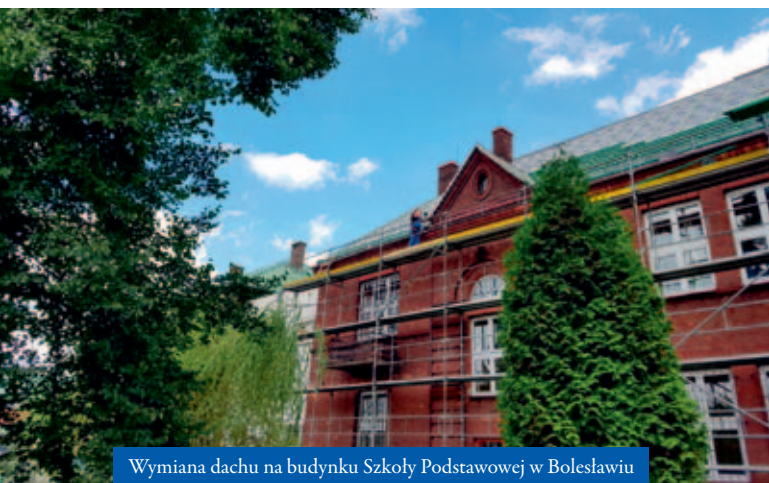
Wymiana dachu na budynku Szkoły Podstawowej w Bolesławiu

Jest to najstarsza szkoła w naszej gminie. Dziś jednak spełnia wszystkie standardy XXI wieku. Od 2015 roku w placówce cyklicznie prowadzone są prace modernizacyjne, które rozpoczęły się od remontów sal lekcyjnych, pokoju nauczycielskiego oraz pokoju logopedy. W kolejnych latach odbył się remont sali gimnastycznej wewnątrz i na zewnątrz oraz bocznych schodów. Gruntownie wyremontowano świetlicę i kuchnię.