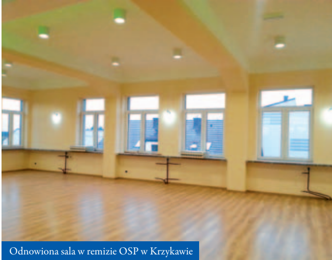
Odnowiona sala w remizie OSP w Krzykawie

Tutejsi strażacy-ochotnicy także mogą pochwalić się bogatą tradycją - dbają o bezpieczeństwo od 1925 roku! Ich strażnica także zaczyna nabierać nowego blasku.