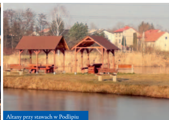
Altany przy stawach w Podlipiu