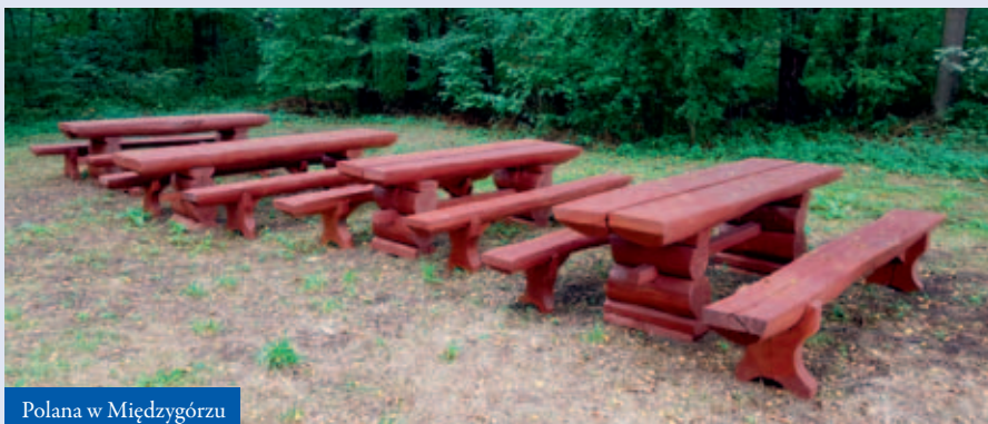
Polana w Międzygórzu

Odnowiono też plac zabaw dla najmłodszych mieszkańców „ Ćmielówki ”. Środki z tego funduszu umożliwiły poprawę i rozbudowę infrastruktury sportowej w Hutkach . W Międzygórzu zagospodarowano polanę do celów rekreacyjnych mieszkańców. Zestaw umieszczonych tam mebli wykonany został w Zakładzie Karnym w Trzebinii. Również w Krzu powstał plac rekreacyjny, który systematycznie będzie wyposażany. ●