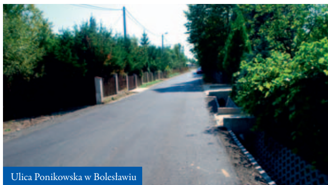
Ulica Ponikowska w Bolesławiu