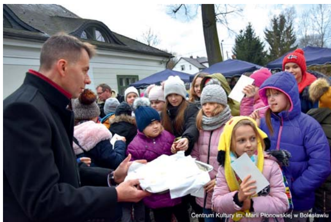
Centrum Kultury im. Marii Płonowskiej w Bolesławiu