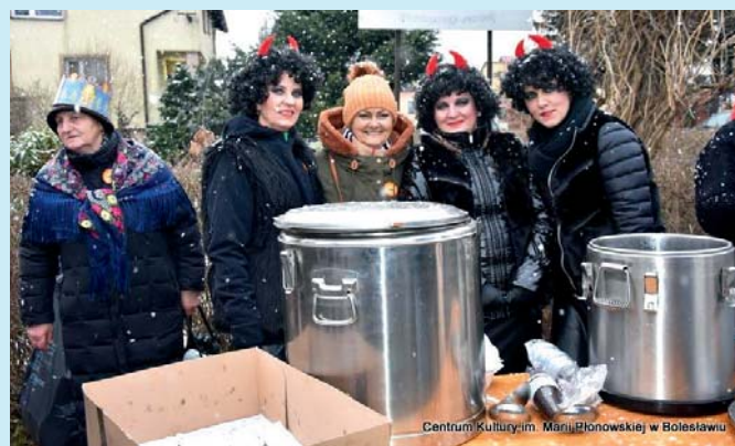
Centrum Kultury im. Marii Płonowskiej w Bolesławiu