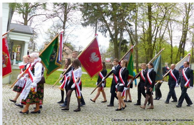
Centrum Kultury im. Marii Płonowskiej w Bolesławiu