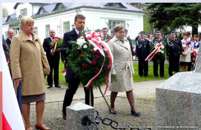
Centrum Kultury im. Marii Płonowskiej w Bolesławiu