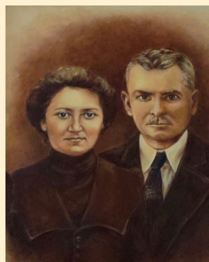
M. Stachurska. Portret Waśniewskich