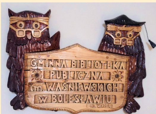
Z. Straś. Płaskorzeźba