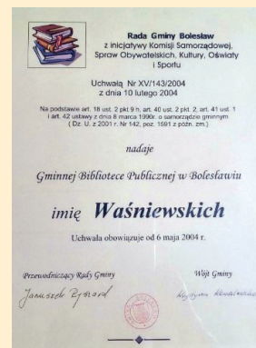
Uchwała ws nadania im. Bibliotece